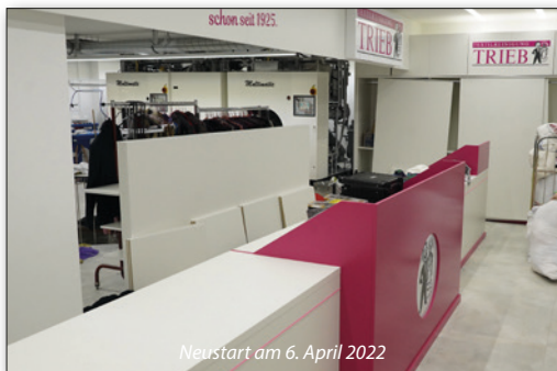
Neustart am 6. April 2022