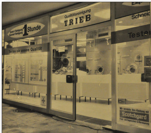
Bereits nach dem zweiten Weltkrieg erfolgte der Umzug in den Hindenburgbau am Hauptbahnhof.

Ende der 80er Jahre, als bekannt wurde, dass das, bis dahin in allen Reinigungen benutzte, Lösungsmittel Fluorchlorkohlenwasserstoff (FCKW) für die Umwelt schädlich ist und die vorhandenen Textilreinigungsanlagen nicht von FCKW auf das weniger schädliche Perchloräthylen (Per) umgestellt werden konnten, wurde sofort wieder reagiert und investiert. Zwei neue Per-Maschinen zum Stückpreis von 200.000,00 DM wurden 1988 angeschafft und dazu