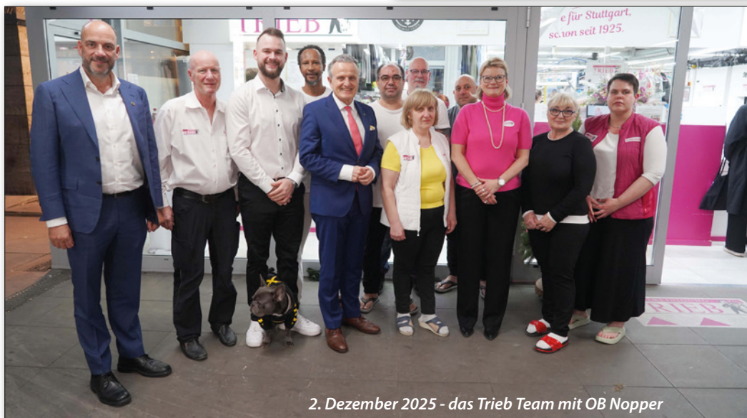
2. Dezember 2025 - das Trieb Team mit OB Nopper