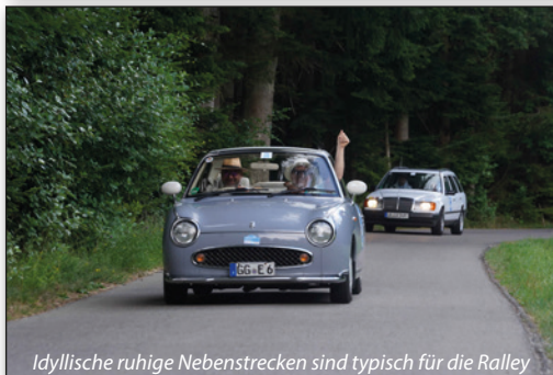
Idyllische ruhige Nebenstrecken sind typisch für die Rallye