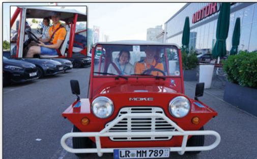
Start der Rallye in der Motorworld mit den jüngsten Teilnehmern