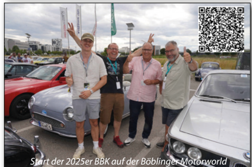
Start der 2025er BBK auf der Böblingen Motorworld