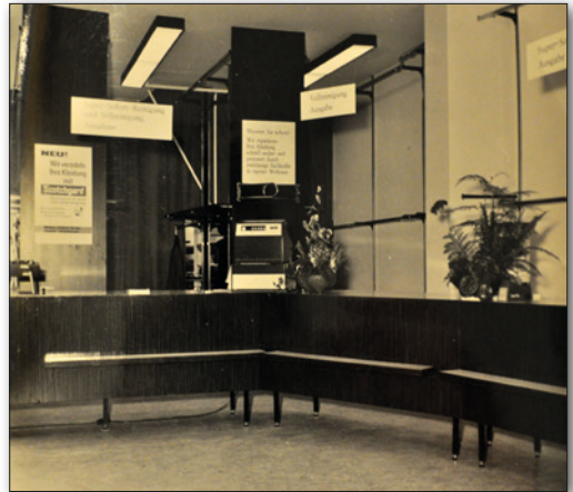
Blick in die Innenräume der Tübinger Straße 1969 mit das erste Farbfoto: das Schaufenster der Tübinger Straße