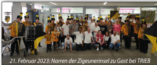
21. Februar 2023: Narren der Zigeunerinsel zu Gast bei TRIEB