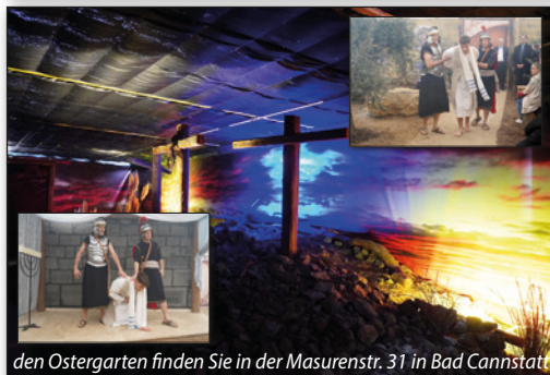
den Ostergarten finden Sie in der Masurenstr. 31 in Bad Cannstatt