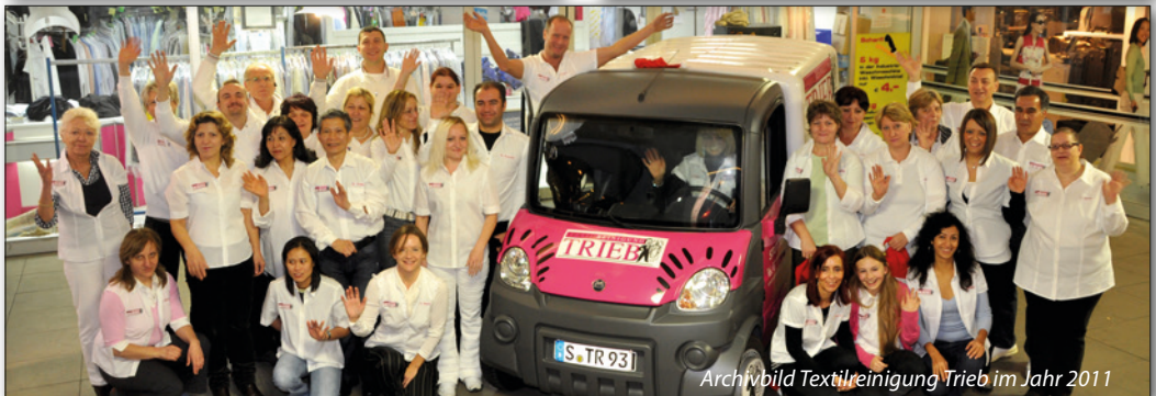
Archivbild Textilreinigung Trieb im Jahr 2011