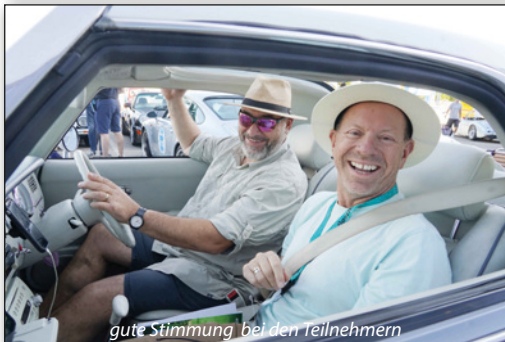
gute Stimmung bei den Teilnehmern