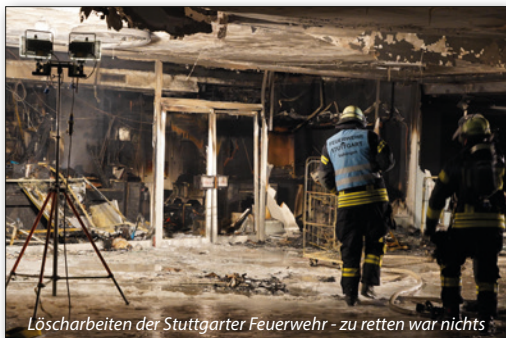
Löscharbeiten der Stuttgarter Feuerwehr - zu retten war nichts