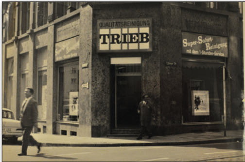
das Geschäft 1969 in der Tübinger Straße