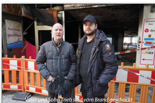
Vater und Sohn Trieb sind vom Brand geschockt