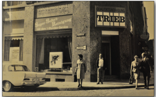
die Filiale in der Tübinger Straße 1969

Zwischen Juni 1971 und Januar 1972 wurde das gesamte Hauptgeschäft in der Hindenburgbau-Passage, ohne jede Betriebsunterbrechung und fast unbemerkt von den Kunden, von Grund auf erweitert und umgebaut. Es erstreckte sich danach über zwei Etagen mit insgesamt 250 Quadratmetern. Dadurch wurde die Kapazität verdoppelt und die „Qualitätsreinigung Trieb“ war in der Lage an einem achtstündigen Arbeitstag ca. 2500 Teile zu reinigen. Gleichzeitig wurde der gesamte Betrieb vollklimatisiert, sowohl der große, hell und freundlich eingerichtete Ladenraum, von dem aus die Reinigungsgeräte direkt beschickt wurden, als auch das im Untergeschoss befindliche „Herz“ des Unternehmens. Hier hatte man die maschinelle Einrichtung völlig neu, mit vier der modernsten und leistungsfähigsten Maschinen für Vollreinigung, die es für die Branche zu diesem Zeitpunkt gab, ausgestattet. Den modernen Anforderungen, möglichst schnell gute Arbeit zu leisten und gleichzeitig beste Bedingungen für das Personal zu schaffen, wurde hier entsprochen. Der gesamte Bedienungsprozess konnte von oben, aus dem Ladenlokal, gesteuert werden. Nach Material, Farbe und Aufgabe wurden die Textilien in verschiedene